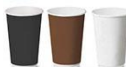
105D, 108D, 109D