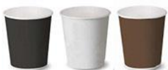
105, 107, 108, 109