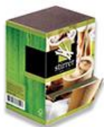
11406 & 13786